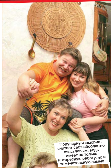
Популярный юморист считает себя абсолютно счастливым, ведь имеет не только интересную работу, но и замечательную семью

— Думаю, да. Все в моей жизни так, как должно быть. Я счастливый человек: у меня интересная работа, я успешный артист, у меня хорошая семья. Чего еще желать? Разве что, чтобы моя мама была здоровой.