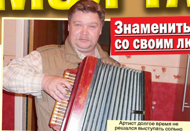
Знаменитый куплетист никогда не расстается со своим любимым музыкальным инструментом

еще... И лишь когда стало совсем невыносимо, принял решение разойтись. Но я не жалею о том, что случилось. Мы вместе проработали 23 года, но всему рано или поздно приходит конец.