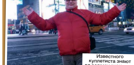
Известного куплетиста знают во всех уголках мира